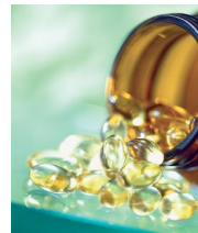
Lýsi er ríkt af Omega-3

Jafnframt er mælt með því að taka lýsi eða Omega-3 fitusýruperlur.