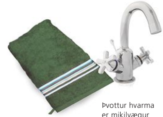
Þvottur hvarma er mikilvægur

Stundum er þynnt barnasjampó (einn hluti sjampó á móti tíu hlutum af vatni) sett í þvottapokann áður en hvarmarnir eru þvegnir. Sjampóið er talið drepa bakteríurnar sem vekja ofnæmið.